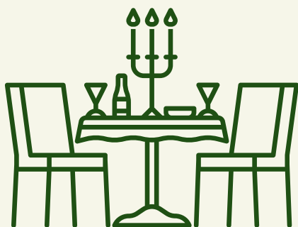
Bares e Restaurantes