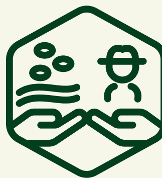
Feira de negócios